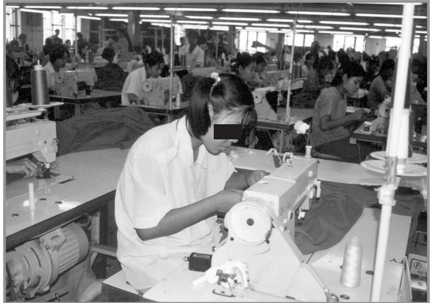
Las grandes marcas de ropa encuentran en Birmania fábricas dispuestas a brindarles productos a precios récord: en algunas empresas, el salario de los trabajadores no calificados no supera los 10-15 dólares mensuales.

Desde finales de los años ochenta, la dictadura militar decidió abrir Birmania a los inversores extranjeros. El país saca provecho directamente: una parte de las divisas procedentes de los inversores va a las arcas de los dictadores en forma de sobornos, compras de licencia (para tener una línea telefónica, un fax, electricidad, etc.), el índice de cambio desfavorable que se aplica a las transacciones oficiales u otras artimañas. Esta voluntad de atraer inversiones extranjeras sirvió de excusa para la utilización de trabajo forzoso, como denuncia la FTUB en su informe sobre la economía birmana de junio de 2002. "La junta ha utilizado muchísimo el trabajo forzoso en condiciones muy duras para desarrollar la infraestructura destinada a la industria del petróleo y del turismo. Las comisiones y las ganancias vinculadas a la explotación de los recursos de gas natural van a parar directamente a manos de los generales. Algunos proyectos hoteleros se llevan a cabo en asociación con los generales y otras empresas que sirven de fachada se ocupan de administrar otros