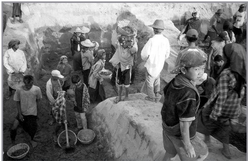
Mujeres, niños, ancianos... Nadie se libra del trabajo forzoso en Birmania.

Ésta es una de las más grandes preocupaciones de la CIOSL: en Birmania no pasa un día sin que los militares obliguen a varios centenares de miles de hombres, mujeres, niños y personas de edad a trabajar contra su voluntad, generalmente sin remuneración. Ese trabajo forzoso adopta formas diversas: construcción y mantenimiento de rutas y de vías férreas, trabajo de mensajero para las tropas, trabajo en los campos confiscados por el ejército a los cam-