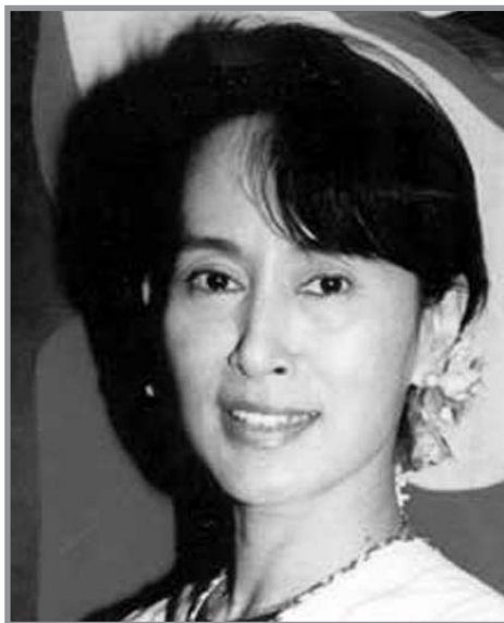
La Premio Nobel de la Paz y líder de la oposición, Aung San Suu Kyi, preconiza la resistencia pacífica y reclama sanciones económicas más fuertes contra la junta. Fue arrestada nuevamente el pasado 31 de mayo.

B irmania se independizó del Reino Unido en enero de 1948, tras largas negociaciones realizadas por el general Aung San, asesinado seis meses antes. A pesar de la actividad de numerosos movimientos rebeldes logró instaurarse una democracia parlamentaria. En 1962, un golpe de Estado militar llevado a cabo por el general Ne Win derrocó al gobierno. El nuevo régimen puso al país en la "vía birmana del socialismo", que ocasionó una catástrofe económica acompañada de una drástica reducción de las libertades. En 1987 y 1988 se hicieron gigantescas manifestaciones para reclamar la dimisión de Ne Win. Este último se retiró en julio de 1988 pero ya era demasiado tarde para que cesara la agitación popular. Las manifestaciones continuaron, principalmente el 8 agosto de 1988, cuando los militares dispararon contra la multitud de manifestantes desarmados. Nunca se supo exactamente la cantidad de muertos que provocó esa salvaje represión pero se sabe con certeza que fueron miles. El ejército tomó el poder y en septiembre de 1988 el "Consejo de Estado para el Restablecimiento de la Ley y el Orden" (más conocido por su sigla inglesa