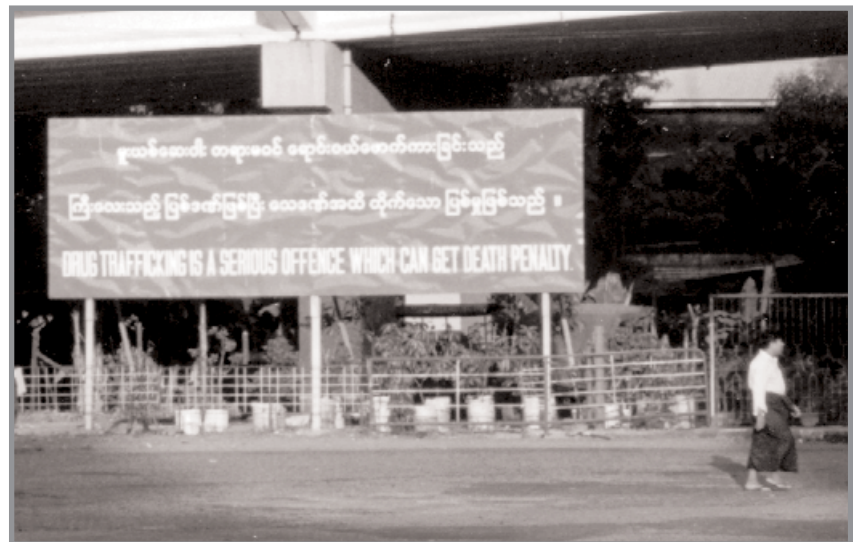
En numerosos anuncios que se ven por todo Birmania, los dictadores amenazan con la pena de muerte a los traficantes de droga. Son los primeros a quienes conciernen dichas advertencias.

Los pequeños campesinos mejoran algo su nivel de vida gracias a la producción de amapola pero los que se enriquecen son principalmente los grandes traficantes, al igual que los generales que los protegen. El barón de la droga birmano más conocido, Khun Sa, vive tranquilamente en Rangún, donde efectúa negocios al igual que su compinche Wei Hsueh-Kang. Los Estados Unidos ejercen sin éxito presión sobre el gobierno birmano para que éste les entregue a esos dos grandes traficantes. Entre tanto, en