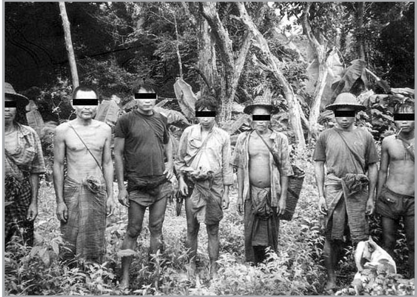
La forma más temida de trabajo forzoso es el reclutamiento de cargadores para el ejército. Los cargadores son golpeados o asesinados por los militares cuando no pueden seguir la columna.